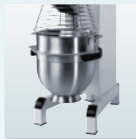
Ab AW R 30 optional automatisches Heben und Senken des Kessels