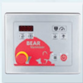
Verschiedene Bediendisplays je nach Maschinenausführung für individuelle Mischprozesse