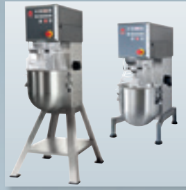
AW R 20 Boden-/ Tischgerät

komplett in Edelstahl, mit 10 l Rührkesselinhalt, mit patentiertem abnehmbarem Magnetschutzschirm aus Kunststoff. Bedienpaneel VL 2 mit digitalem Timer und Notstopp. Im Lieferumfang enthalten: Rührkessel, Rührer, Rührbesen, Knethaken, Abstreifer komplett.