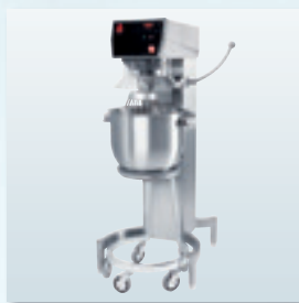
„Kodiak“ AW R 20.2 „Kodiak“ AW R 30.2 Kesselrolly serienmäßig