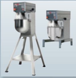
AW R 10 Boden-/ Tischgerät

komplett in Edelstahl, mit 10 l Rührkesselinhalt, mit patentiertem abnehmbarem Magnetschutzschirm aus Kunststoff. Bedienpaneel VL 2 mit digitalem Timer und Notstopp. Im Lieferumfang enthalten: Rührkessel, Rührer, Rührbesen, Knethaken, Abstreifer komplett.