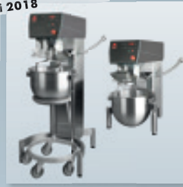
„Kodiak“ AW R 20.2 Boden-/ Tischgerät

komplett in Edelstahl, mit 20 l Rührkesselinhalt, mit patentiertem abnehmbarem Magnetschutzschirm aus Kunststoff. Bedienpaneel mit digitalem Timer und Notstopp. Im Lieferumfang enthalten: Rührkessel, Rührer, Rührbesen und Knethaken Edelstahl, bei Bodengerät mit Kesselrolley.