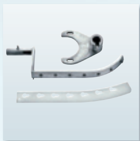
Patentierter Abstreifer für ein homogenes Vermischen aller Zutaten